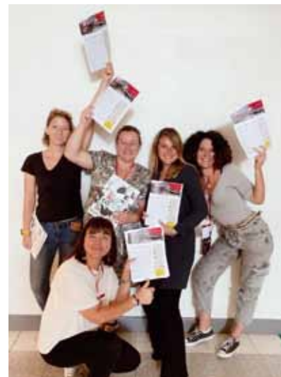
Accueil des stagiaires à l'ENFiP de Clermont Fd

Ce dispositif de formation s'inscrit dorénavant dans le dispositif réglementaire interministériel matérialisé par le schéma directeur de la formation professionnelle tout au long de la vie des agents de l'État (SDFPTLV), porté par décret n°2007-1470 du 15 octobre 2007 modifié. Cet instrument de coordination des politiques de formation vise à définir les priorités de formation dans les domaines communs et à coordonner les actions. Ce décret prévoit que « chaque ministre établit, après concertation avec les organisations représentatives du personnel, un document d'orientation à moyen terme de la formation des agents des administrations relevant de son autorité... Il est révisé dans les mêmes formes, au moins tous les trois ans ». Ce document d'orientation s'intègre dans la politique RH globale du ministère, dans le cadre des lignes directrices de gestion ministé-