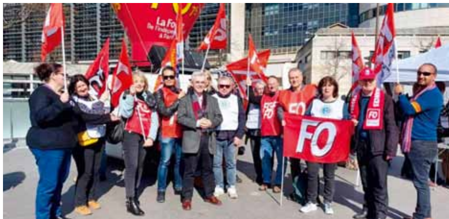
Manifestation du 10 mars 2022 des douaniers devant Bercy

Renouvelant avec une méthode de travail plus respectueuse des interlocuteurs