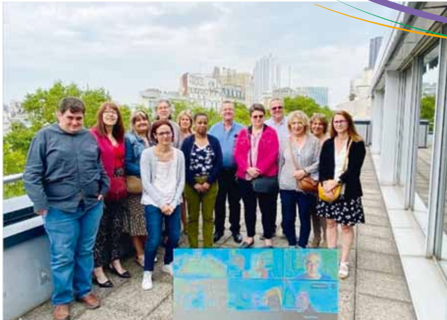
Réunion confédérale sur le Handicap du 12 juin 2023

de corps (2.5 points de moins que leurs homologues).