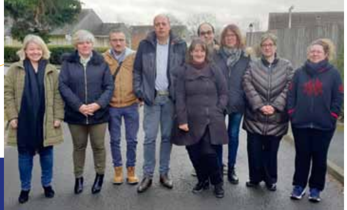
Section fédérale du Calvados