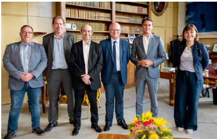
Délégation fédérale reçue par M. Attal le 5 septembre 2022

C'est le jour même de la décision du Conseil constitutionnel sur la loi retraites, le 14 avril, que nous recevions une réponse pour le moins sibylline, nous invitant à nous rendre au CSA convoqué le 16 avril.