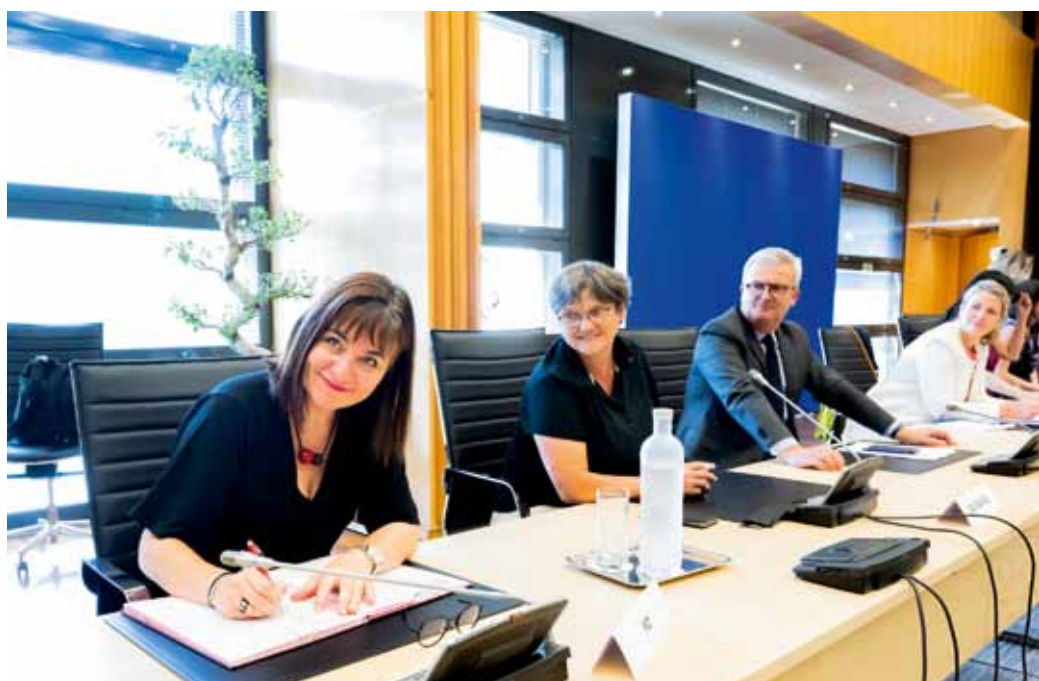
Signature de l'accord-cadre du 7 juillet 2022

Autre sujet de discussion, le droit à la déconnexion, il doit permettre de préserver