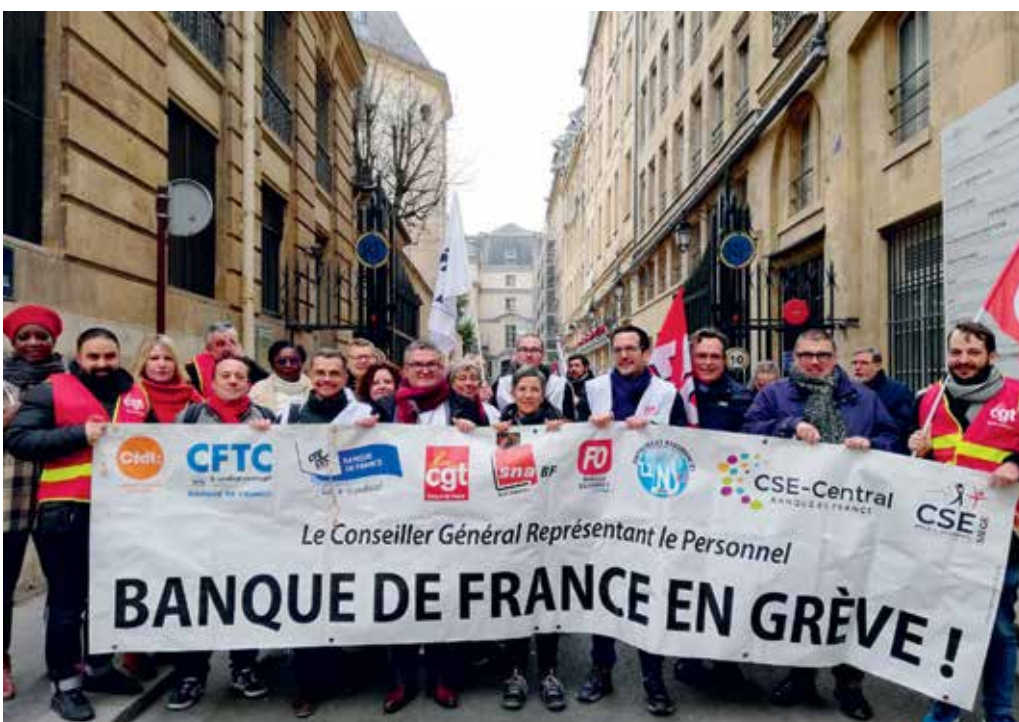
Manifestation du 31 janvier 2023